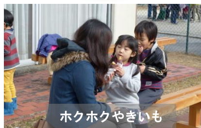
ホクホクやきいも

公民館では、今回参加いただいたサークルの他にも、様々なサークル活動が行われています。詳しくはホームページをご覧ください。山口公民館まで気軽にお問い合わせください。