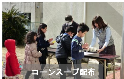
コーンスープ配布