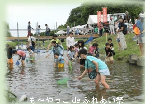
も〜やっこ de ふれあい祭