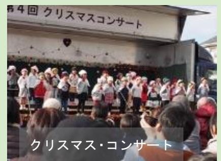
クリスマス・コンサート