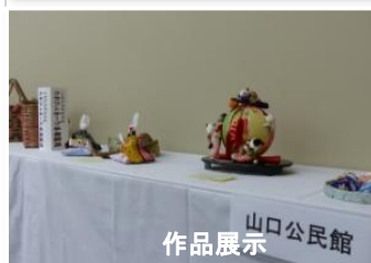
作品展示 山口公民館