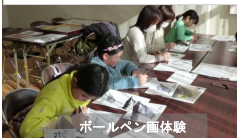
ボールペン画体験