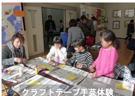
クラフトテープ手芸体験