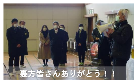
裏方皆さんありがとう！！