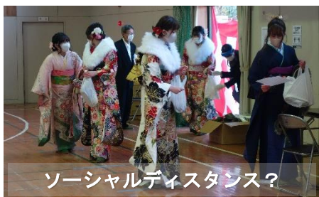
ソーシャルディスタンス？