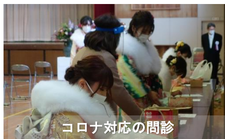
コロナ対応の問診